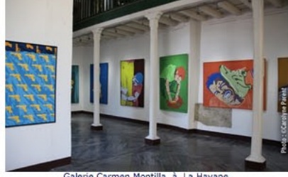
Galerie Carmen Montilla, à La Havane.