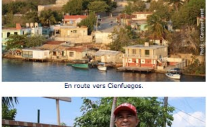
En route vers Cienfuegos.