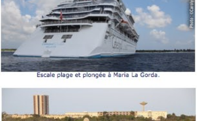
Escale plage et plongée à Maria La Gorda.