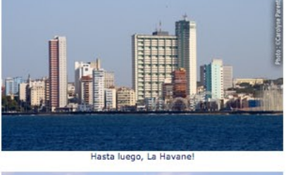
Hasta luego, La Havane!