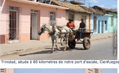
À Trinidad, située à 80 kilomètres de notre port d'escale, Cienfuegos.